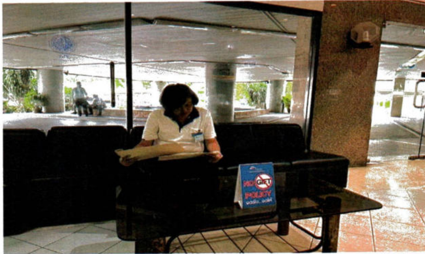
บริเวณจุดพักรอผู้มาติดต่อราชการ