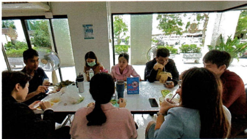
บริเวณโรงอาหาร