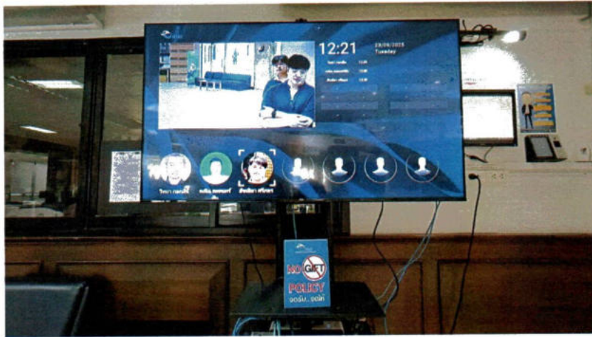
บริเวณเครื่องสแกนลงเวลาเช้า - ออก