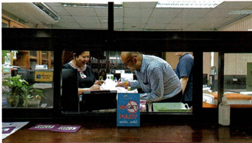
บริเวณฝ่ายบริหารงานทั่วไป (งานรับ - ส่งเอกสาร) สำนักบริหารกลาง