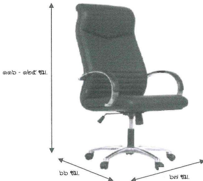
รูปตัวอย่าง

รายการที่ ๑ เก้าอี้ประธาน ขวางทุ่งพญาไท เขตราชเทวี กรุงเทพมหานคร จำนวน ๔ ตัว มีรายละเอียดอย่างน้อย ดังนี้