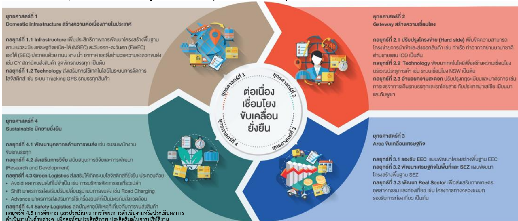
รูปที่ 2-1 ยุทธศาสตร์ของแผนยุทธศาสตร์กระทรวงคมนาคมเพื่อสนับสนุนการพัฒนาาระบบโลจิสติกส์ของประเทศ ฉบับที่ 3 (พ.ศ. 2560 - 2565)