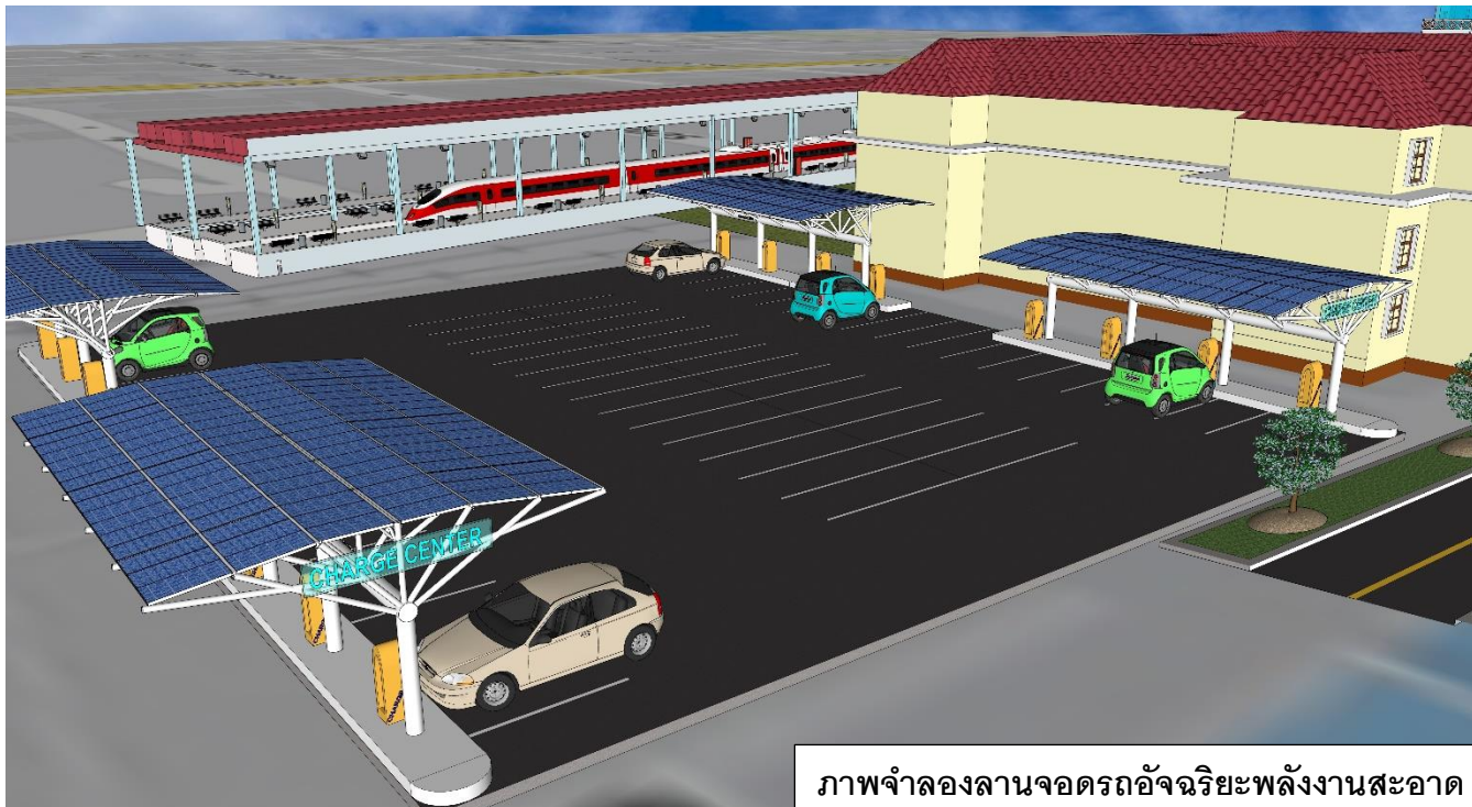
ภาพจำลองลานจอดรถอัจฉริยะพลังงานสะอาด