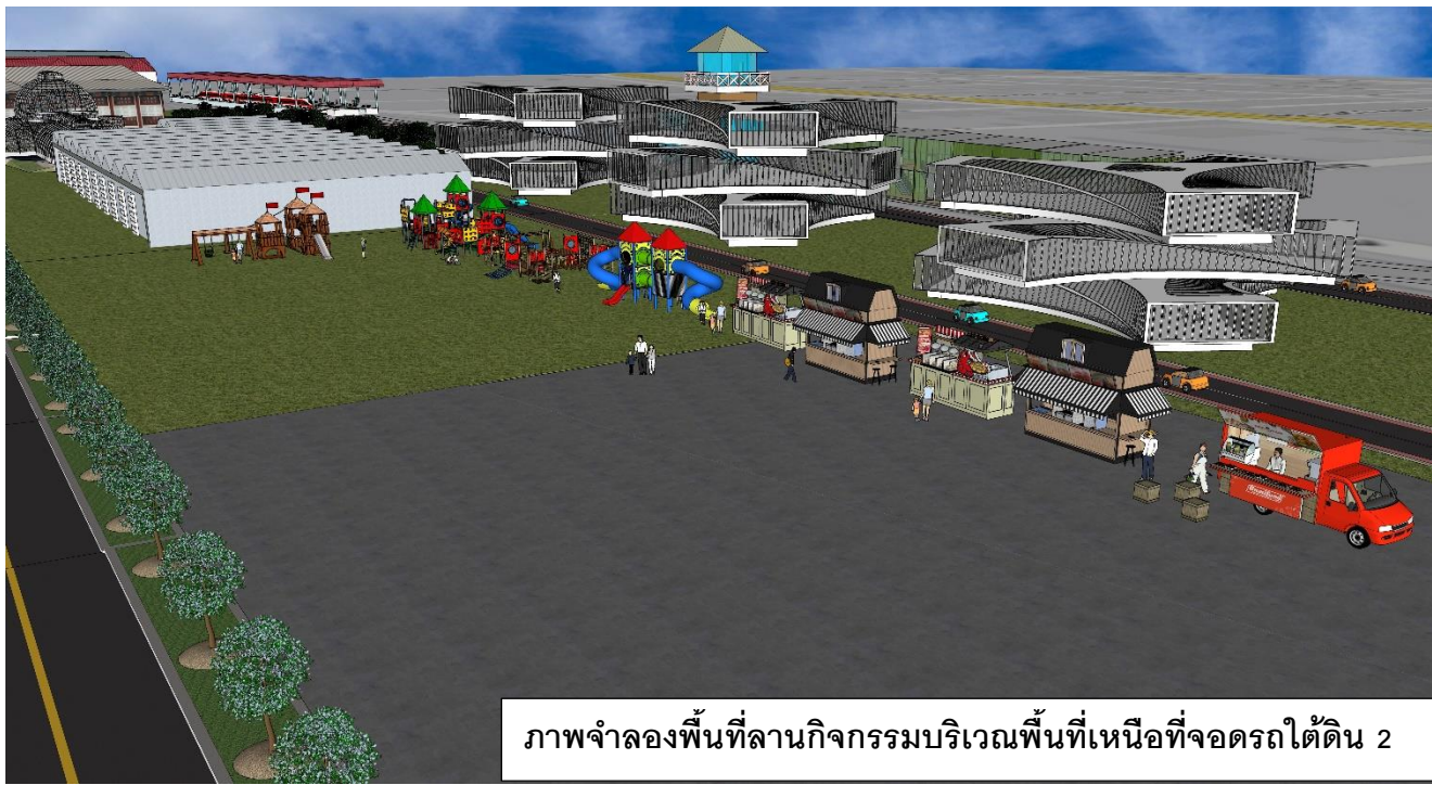
ภาพจำลองพื้นที่ลานกิจกรรมบริเวณพื้นที่เหนือที่จอดรถใต้ดิน 2