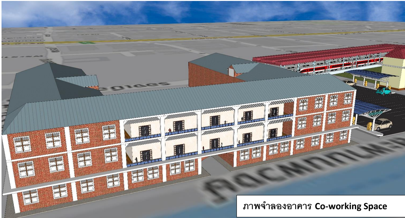
ภาพจำลองอาคาร Co-working Space