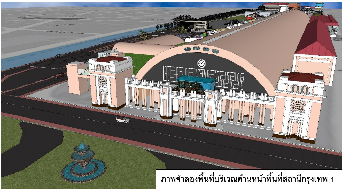
ภาพจำลองพื้นที่บริเวณด้านหน้าพื้นที่สถานีกรุงเทพ 1