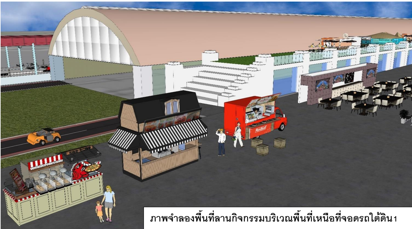
ภาพจำลองพื้นที่ลานกิจกรรมบริเวณพื้นที่เหนือที่จอดรถใต้ดิน 1