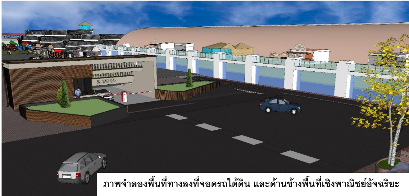
ภาพจำลองพื้นที่ทางลงที่จอดรถใต้ดิน และด้านข้างพื้นที่เชิงพาณิชย์อัจฉริยะ