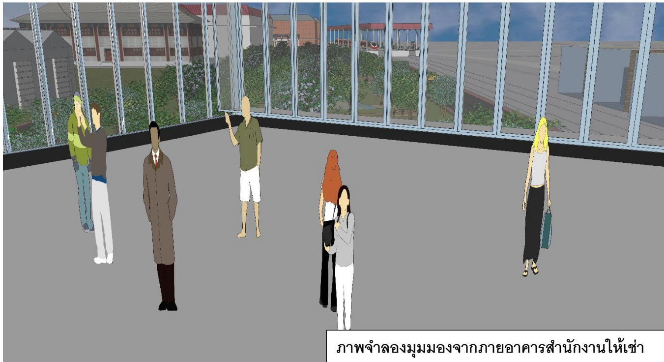
ภาพจำลองมุมมองจากภายในอาคารสำนักงานให้เข้า