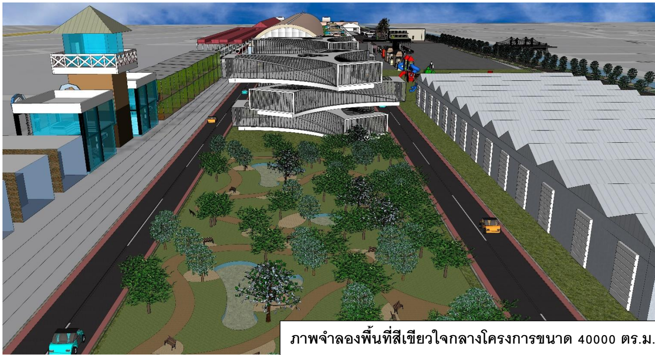
ภาพจำลองพื้นที่สีเขียวใจกลางโครงการขนาด 40000 ตร.ม.