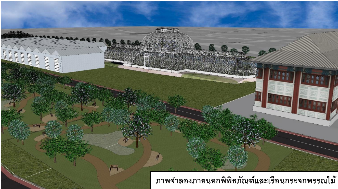
ภาพจำลองภายนอกพิพิธภัณฑ์และเรือนกระจกพรรณไม้