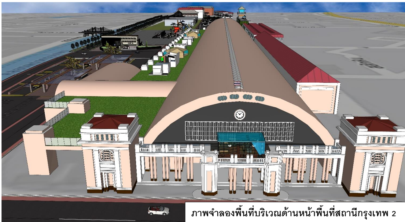
ภาพจำลองพื้นที่บริเวณด้านหน้าพื้นที่สถานีกรุงเทพ 2