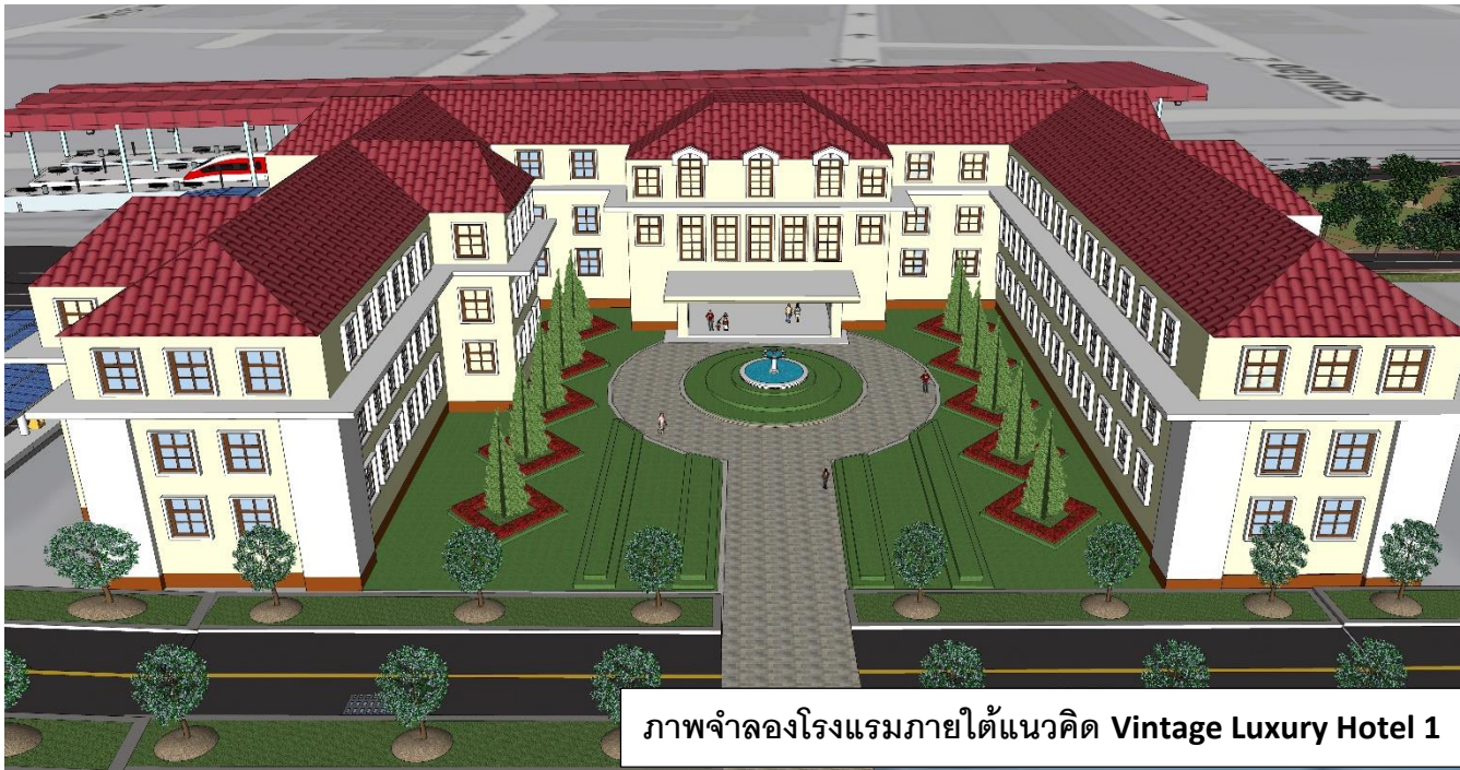
ภาพจำลองโรงแรมภายใต้แนวคิด Vintage Luxury Hotel 1