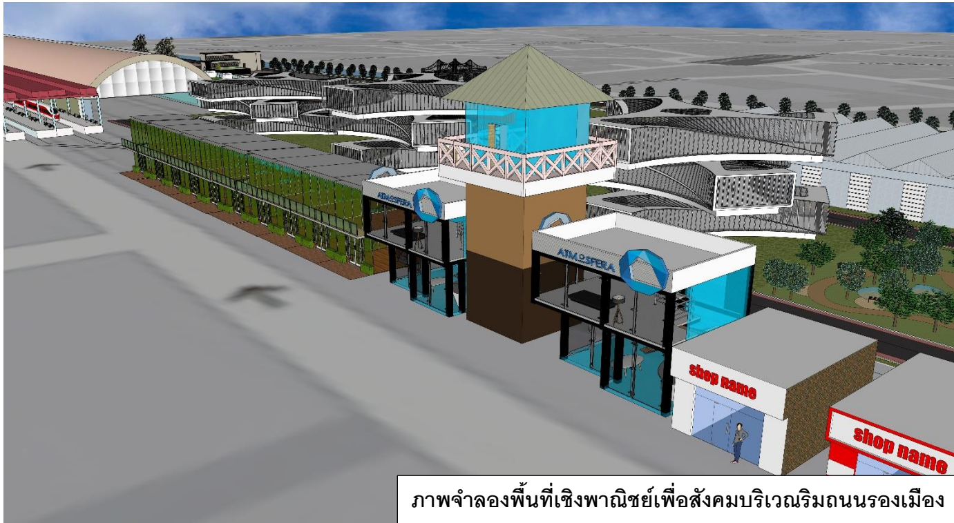
ภาพจำลองพื้นที่เชิงพาณิชย์เพื่อสังคมบริเวณริมถนนรองเมือง