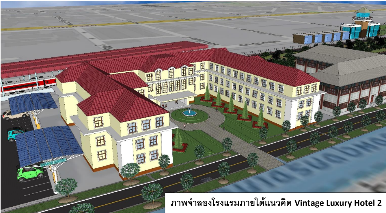
ภาพจำลองโรงแรมภายใต้แนวคิด Vintage Luxury Hotel 2