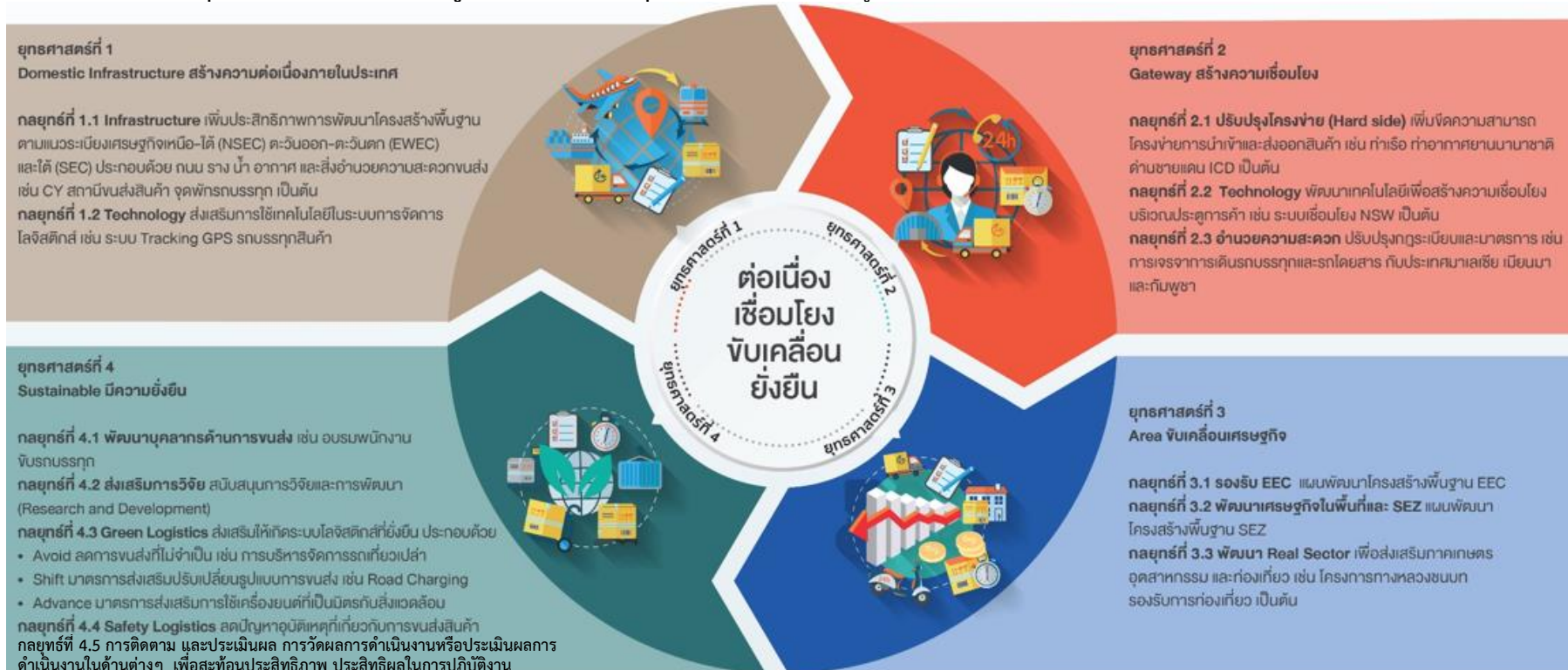
รูปที่ 2-1 ยุทธศาสตร์ของแผนยุทธศาสตร์กระทรวงคมนาคมเพื่อสนับสนุนการพัฒนาระบบโลจิสติกส์ของประเทศ ฉบับที่ 3 (พ.ศ. 2560 - 2564)