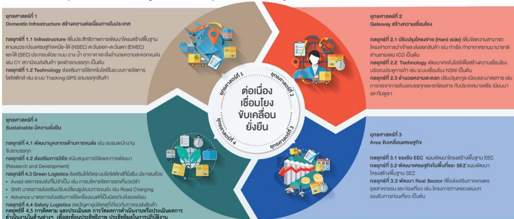
รูปที่ 2-1 ยุทธศาสตร์ของแผนยุทธศาสตร์กระทรวงคมนาคมเพื่อสนับสนุนการพัฒนาระบบโลจิสติกส์ของประเทศ ฉบับที่ 3 (พ.ศ. 2560 - 2564)