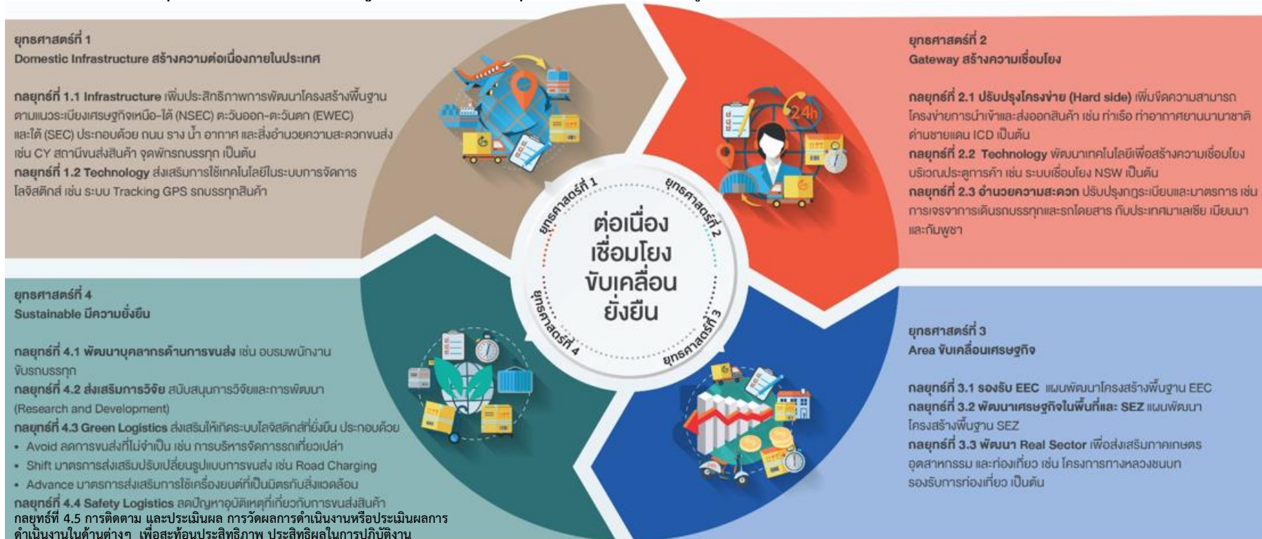
รูปที่ 2-1 ยุทธศาสตร์ของแผนยุทธศาสตร์กระทรวงคมนาคมเพื่อสนับสนุนการพัฒนาระบบโลจิสติกส์ของประเทศ ฉบับที่ 3 (พ.ศ. 2560-2564)