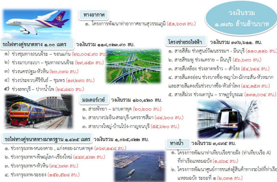
ภาพที่ ๒ แสดงแผนงาน/โครงการ ภายใต้แผนปฏิบัติการด้านคมนาคมขนส่งระยะเร่งด่วน พ.ศ. ๒๕๕๙ (Action Plan)