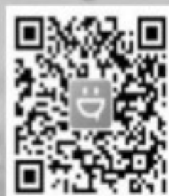
แอปพลิเคชันช่วยในสนามบิน

ด้วยตนเองอัตโนมัติ (Common Use Self Service: CUSS) ระบบรับกระเป๋าสัมภาระอัตโนมัติ (Common Use Bag-Drop: CUBD) ตลอดจนได้มีการปรับปรุงห้องนำภายในอาคารผู้โดยสารใหม่ให้มีความทันสมัยสวยงาม ฯลฯ เพื่อให้มีความพร้อมรองรับปริมาณผู้โดยสารและการจราจรทางอากาศที่จะฟื้นตัวเข้าสู่ภาวะปกติภายหลังการระบาดของโรค COVID-19