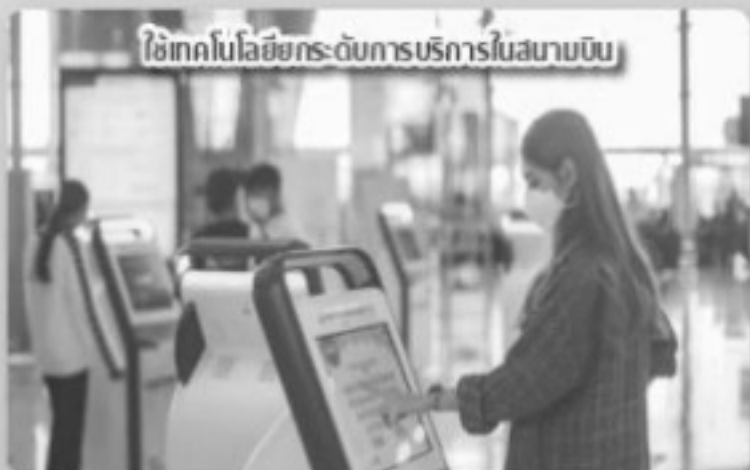
ใช้เทคโนโลยีขั้นสูงในการบริการในสนามบิน

ตลอดระยะเวลากว่า 2 ปี ที่ทั่วโลกเผชิญกับวิกฤตการณ์การแพร่ระบาดของโรคติดเชื้อไวรัสโคโรนา 2019 (COVID-19) ส่งผลกระทบต่ออย่างรุนแรงต่อทุกภาคส่วน โดยเฉพาะอุตสาหกรรมการบินทั่วโลก จากที่ ทสภ. เคยรองรับผู้โดยสารสูงสุดประมาณ 220,000 คนต่อวัน คงเหลือผู้โดยสารที่มาใช้บริการเพียงประมาณ 700 คนต่อวัน แม้จะเป็นช่วงเวลาที่ยากลำบาก หลายธุรกิจต้องปิดตัวลง แต่ ทสภ. ยังคงยืนหยัดทำหน้าที่ท่าอากาศยานหลักของประเทศ เปิดให้บริการผู้โดยสารภายใต้มาตรการป้องกันโรคที่เข้มงวดและพัฒนาอย่างต่อเนื่อง โดยดำเนินการปรับปรุงสิ่งอำนวยความสะดวกในด้านต่าง ๆ อาทิ ปรับปรุงจุดตรวจค้นร่างกายและสัมภาระ ปรับปรุงเคาน์เตอร์ตรวจหนังสือเดินทาง ติดตั้งระบบเช็กอิน