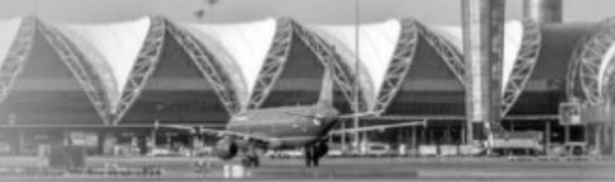
ปลอดภัยคือมาตรฐาน บริการคือหัวใจ

ตลอดระยะเวลา 16 ปีของการดำเนินงาน ทสภ. ได้ร่วมเป็นส่วนหนึ่งในการขับเคลื่อนเศรษฐกิจไทย ในฐานะท่าอากาศยานหลักของประเทศ และการก้าวสู่ปีที่ 17 ต่อจากนี้ ในช่วงเวลาที่ทั่วโลกกำลังฟื้นจากวิกฤตการณ์ COVID-19 ทสภ. จะยังคงมุ่งมั่นทำหน้าที่ให้การต้อนรับและสร้างความประทับใจแก่ผู้มาเยือนประเทศไทยจากทั่วทุกมุมโลก ด้วยบริการที่ปลอดภัยตามมาตรฐานสากล และยังคงเป็นหนึ่งฟันเฟืองที่ร่วมกับทุกภาคส่วนในการฟื้นฟูเศรษฐกิจไทยให้มั่นคงและยั่งยืน