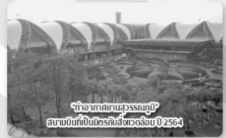
ท่าอากาศยานสุวรรณภูมิ สนามบินที่ป็นมิตรกับสิ่งแวดล้อม ปี 2564

ดีมาก (G เงิน) จากกรมส่งเสริมคุณภาพสิ่งแวดล้อม กระทรวงทรัพยากรธรรมชาติและสิ่งแวดล้อม เป็นหนึ่งในการรับรองว่า ทสภ. ได้บริหารจัดการท่าอากาศยานควบคู่ไปกับการรับผิดชอบต่อสังคมและสิ่งแวดล้อม ภายใต้แนวคิดการเป็นสนามบินที่เป็นพลเมืองที่ดีของสังคม และเป็นเพื่อนบ้านที่ดีของชุมชน (Corporate Citizenship Airport)