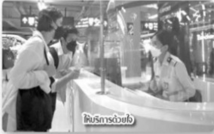
ให้บริการด้วยใจ

วันที่ 28 กันยายน 2565 ท่าอากาศยานสุวรรณภูมิ (ทสภ.) บริษัท ท่าอากาศยานไทย จำกัด (มหาชน) (ทอท.) ดำเนินงานมาครบรอบ 16 ปี และกำลังก้าวสู่ปีที่ 17 พร้อมศักยภาพและขีดความสามารถที่เพิ่มขึ้นอย่างไม่หยุดยั้ง เพื่อบรรลุเป้าหมายสำคัญสูงสุดคือการมอบความสะดวกสบายแก่ผู้ใช้บริการ ด้วยมาตรฐานความปลอดภัยที่เป็นสากล ทำหน้าที่ประตูบานหลักเปิดต้อนรับผู้มาเยือนจากทั่วทุกมุมโลก พร้อมสร้างความประทับใจและความเชื่อมั่นตั้งแต่ก้าวแรกที่มาถึงประเทศไทย