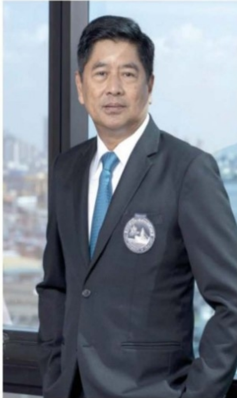
เรือโท กมลศักดิ์ พรหมประยูร

การทำเรือฯ เผยผลการดำเนินงาน 5 ท่า รอบ 9 เดือนปี 64 พบสินค้าผ่านท่าขยายตัวสูงขึ้นอย่างต่อเนื่อง มีเรือเทียบท่าที่ ท่าเรือกรุงเทพ และ ท่าเรือแหลมฉบัง รวม 10,187 เที่ยว ลดลง 3.65% สินค้าผ่านท่า 83,011 ล้านตัน เพิ่มขึ้น 1.79% และตู้สินค้าผ่านท่า 7,301 ล้าน ที.อี.ยู. เพิ่มขึ้น 6.079% คิดเป็นกำไร 4,849 ล้านบาท เรือโท กมลศักดิ์ พรหมประยูร ผู้อำนวยการท่าเรือแห่งประเทศไทยเปิดเผยถึงผลการดำเนินงานของการท่าเรือแห่งประเทศไทย (กทท.) ในการให้บริการเรือ สินค้า และตู้สินค้าผ่านท่าเรือกรุงเทพ (ทกท.) ท่าเรือ