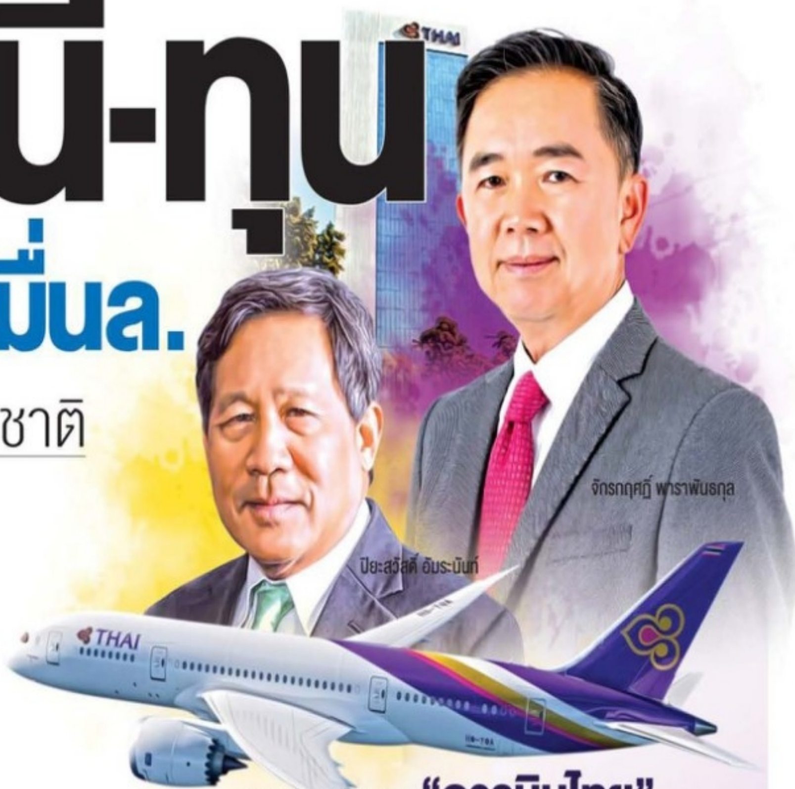
ฐานะการเงินของ "การบินไทย"