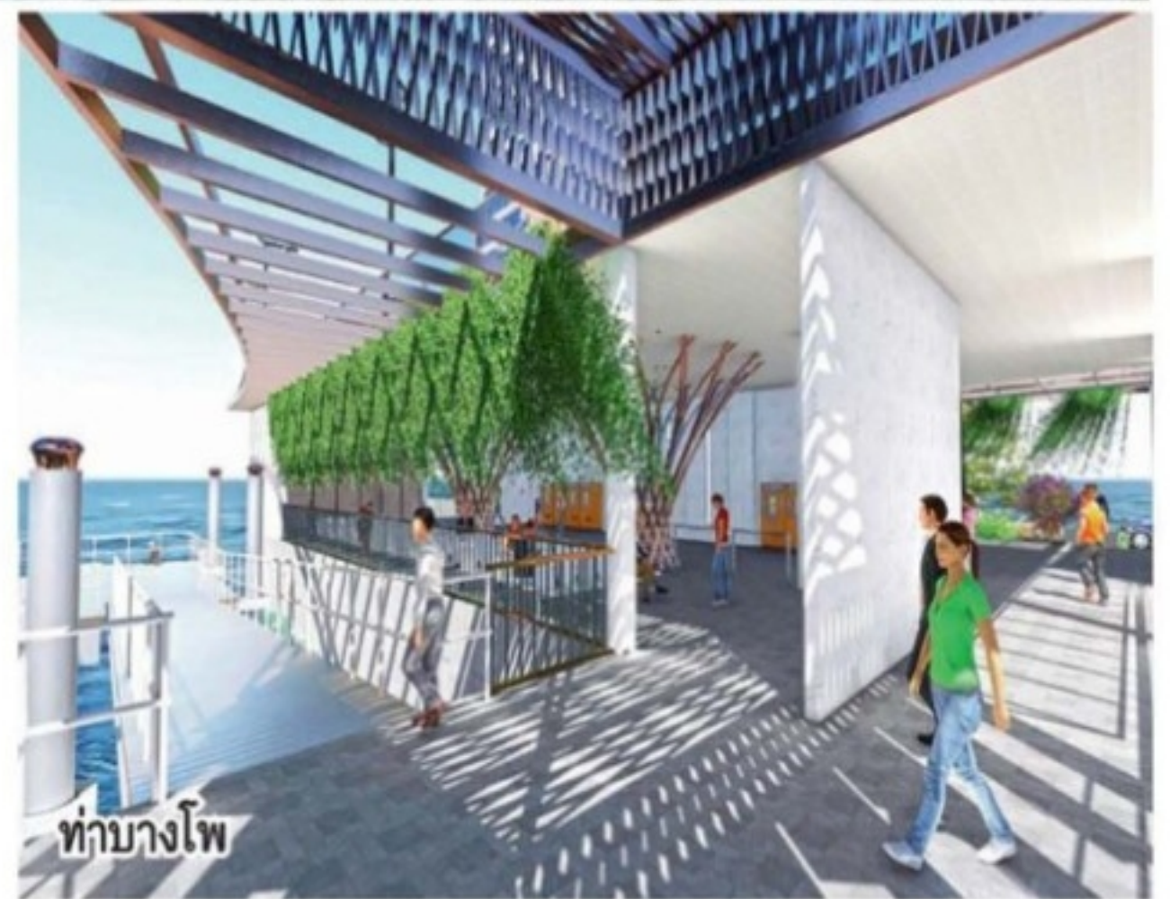
ท่าบางโพ

ขณะที่ กรุงเทพมหานคร-ชะอำ-หัวหิน จะเป็นพื้นที่ปิดท้ายของปีนี้ แต่ยังคงติดตามเมื่อสถิติการติดเชื้อยังไม่ทุเลา รัฐบาลจะเขย่า สลับสับเปลี่ยนพื้นที่จังหวัดอีกหรือไม่