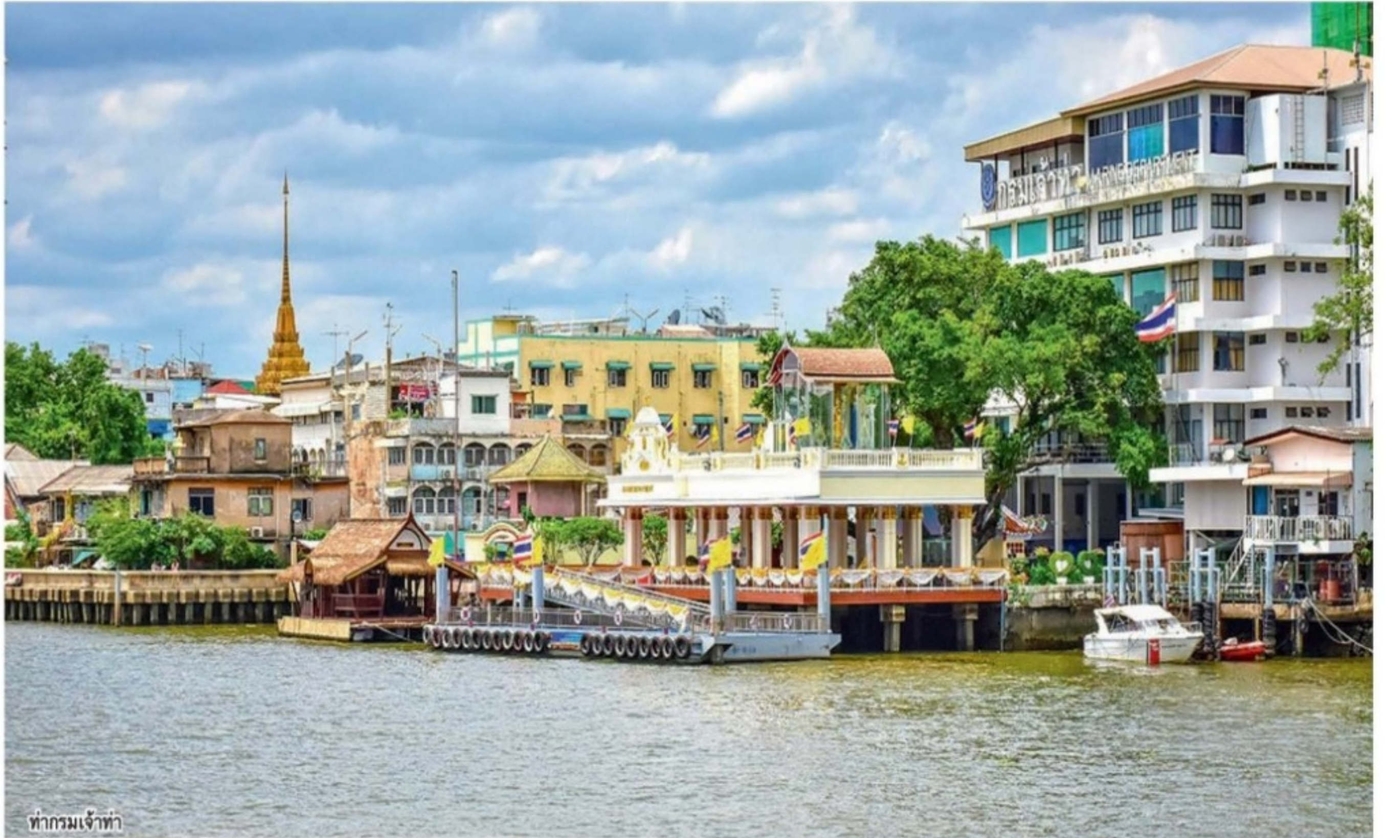
ท่ากรมเจ้าท่า

เมื่อเศรษฐกิจไปต่อไม่ได้ ทำให้รัฐบาลต้องจำใจเปิดประเทศ ต้อนรับนักท่องเที่ยวต่างชาติเข้ามา ปลูกมุดเศรษฐกิจที่ฟูทั้งระบบให้ไปต่อท่ามกลางวิกฤตโควิด ในเมื่อ ท่องเที่ยว คือ หัวใจไม่มีรายได้เข้าประเทศ แม้ยอดผู้ป่วยโควิด-19 ยังทะยานรายวัน จากหลักพัน ไกลแตะหลักหมื่น จน รัฐบาล คุมไม่อยู่ ต้องประกาศ ล็อกดาวน์ 10 จังหวัดเสี่ยง ได้แก่ กรุงเทพมหานคร นครปฐม นนทบุรี ปทุมธานี สมุทรปราการ สมุทรสาคร ปัตตานี นราธิวาส และยะลา เป็นระยะเวลา 14 วัน เดิมพันการเปิดประเทศให้ได้ภายใน 120 วัน ที่กำลังใกล้งวดเข้ามาทุกขณะ