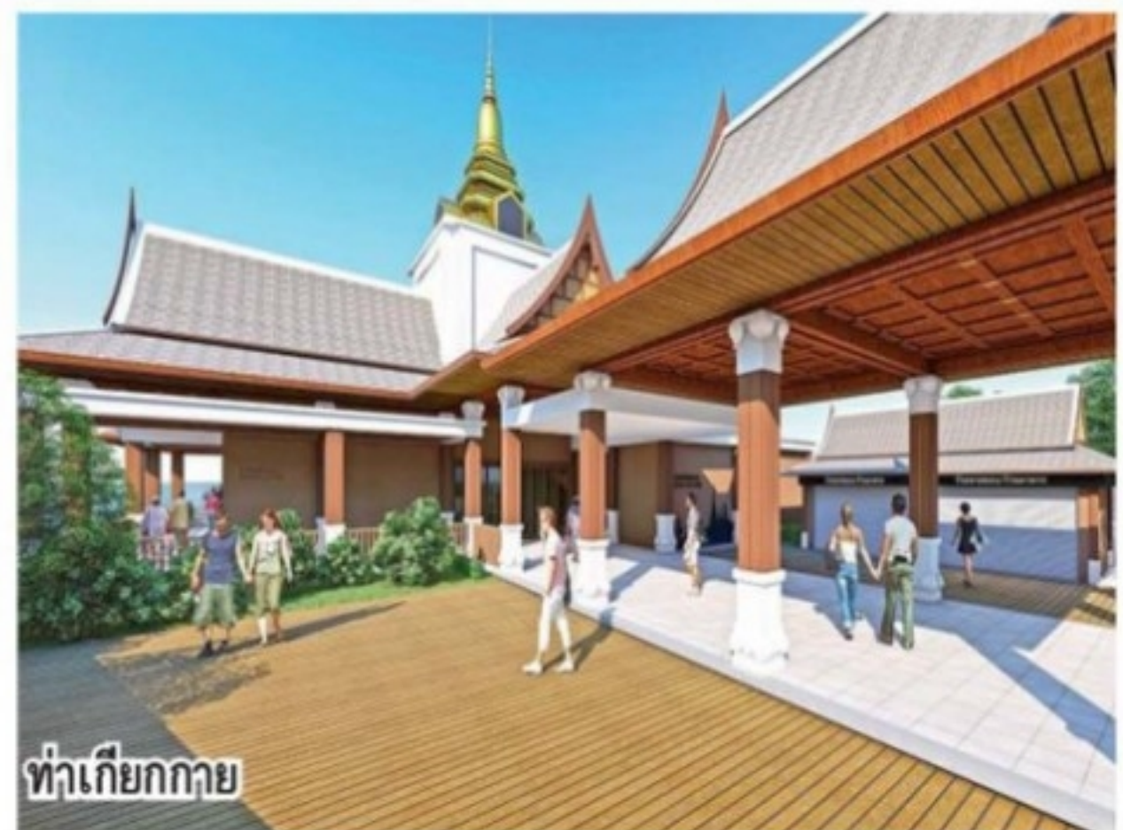
ท่าเกียกกาย

จะเริ่มปรับปรุงในปี 2565-2566 มีท่าราชวงศ์ ท่าสี่พระยา ท่าพระปิ่นเกล้า ท่าพระราม 5 ท่าเขี้ยวไวกา ท่าสะพานกรุงธน ท่าพรานนก ท่าเทเวศร์ "ภาพท่าเรือโทรมๆ ท่าเทียบเรือเก่าๆ โป๊ะเล็กๆ จะหมดไป ทุกท่าจะเปลี่ยน