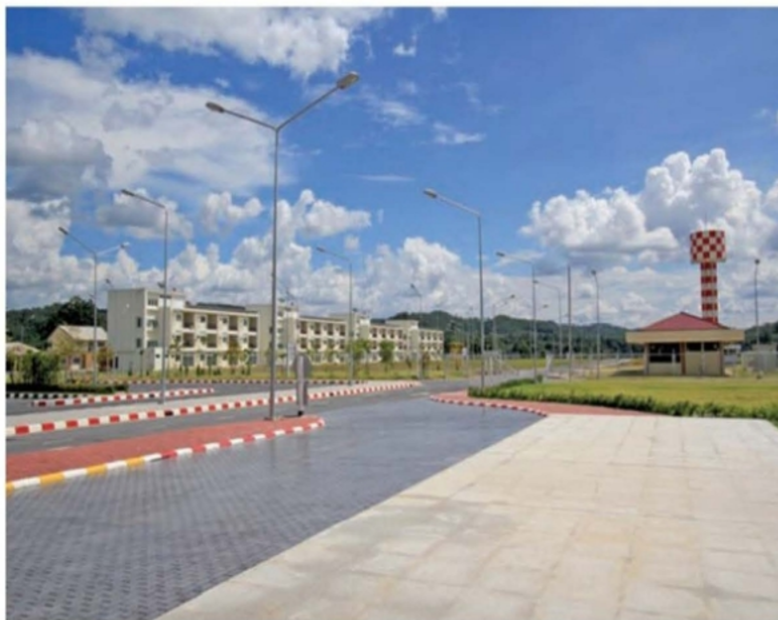
ภายในพื้นที่สนามบิน

บริเวณที่จอดรถผู้โดยสารด้านนอก เสาต้นหน้าที่รับหลังคาทั้งสามด้าน ถูกหุ้มด้วยไม้ไผ่กลม วางแนวนอนเป็นรูปสี่เหลี่ยม ซ้อนกันเป็นชั้นๆ และค่อยๆ บิดเป็นเกลียวและบานขึ้นเรื่อยๆ ไปด้านบนเป็นรูปสี่เหลี่ยมข้าวหลามตัด และในบริเวณผนังด้านหน้าของอาคารผู้โดยสารใช้เทคนิคการซ้อนชั้นของไม้ไผ่เช่นเดียวกัน ตัวอาคารมีสีน้ำตาลทอง ลวดลายไม้ไผ่ และหินอ่อนที่มีลวดลายสีถึงทะเลหมอก