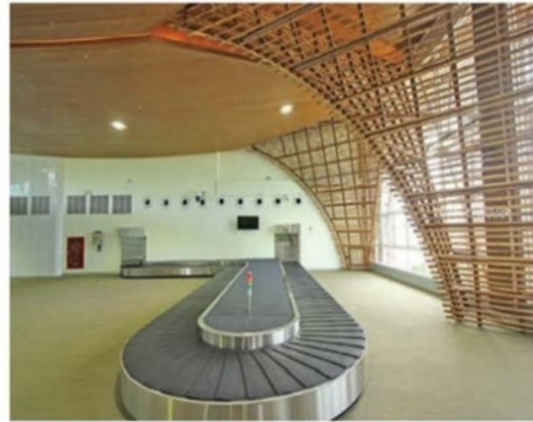
สายพานรับกระเป๋า

“สนามบินเบตง” หรือ “ท่าอากาศยานนานาชาติเบตง” ตั้งอยู่ที่ ตำบลยะรม อำเภอเบตง จังหวัดยะลา โดยห่างจากตัวเมืองเบตงไปทางทิศตะวันออกเฉียงเหนือ ประมาณ 10 กิโลเมตร เป็นท่าอากาศยานแห่งใหม่ ลำดับที่ 29 สังกัดกรมท่าอากาศยาน กระทรวงคมนาคม และนับเป็นท่าอากาศยานแห่งที่ 39 ของประเทศไทย