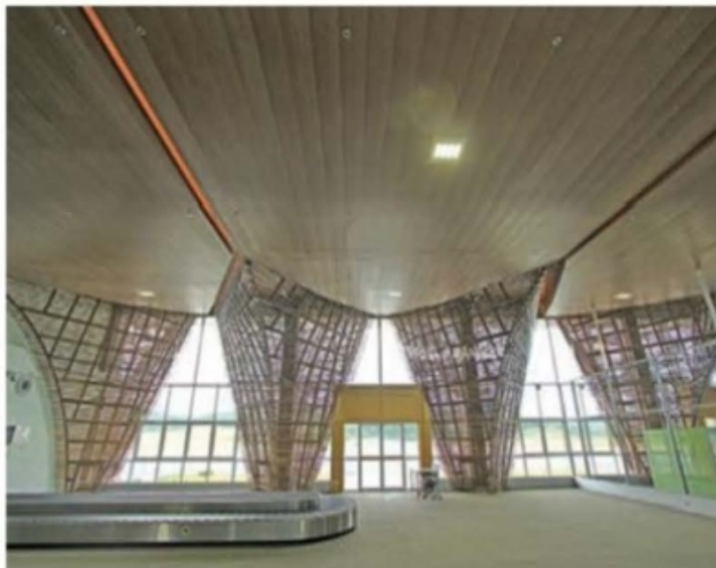
อาคารผู้โดยสารด้านใน