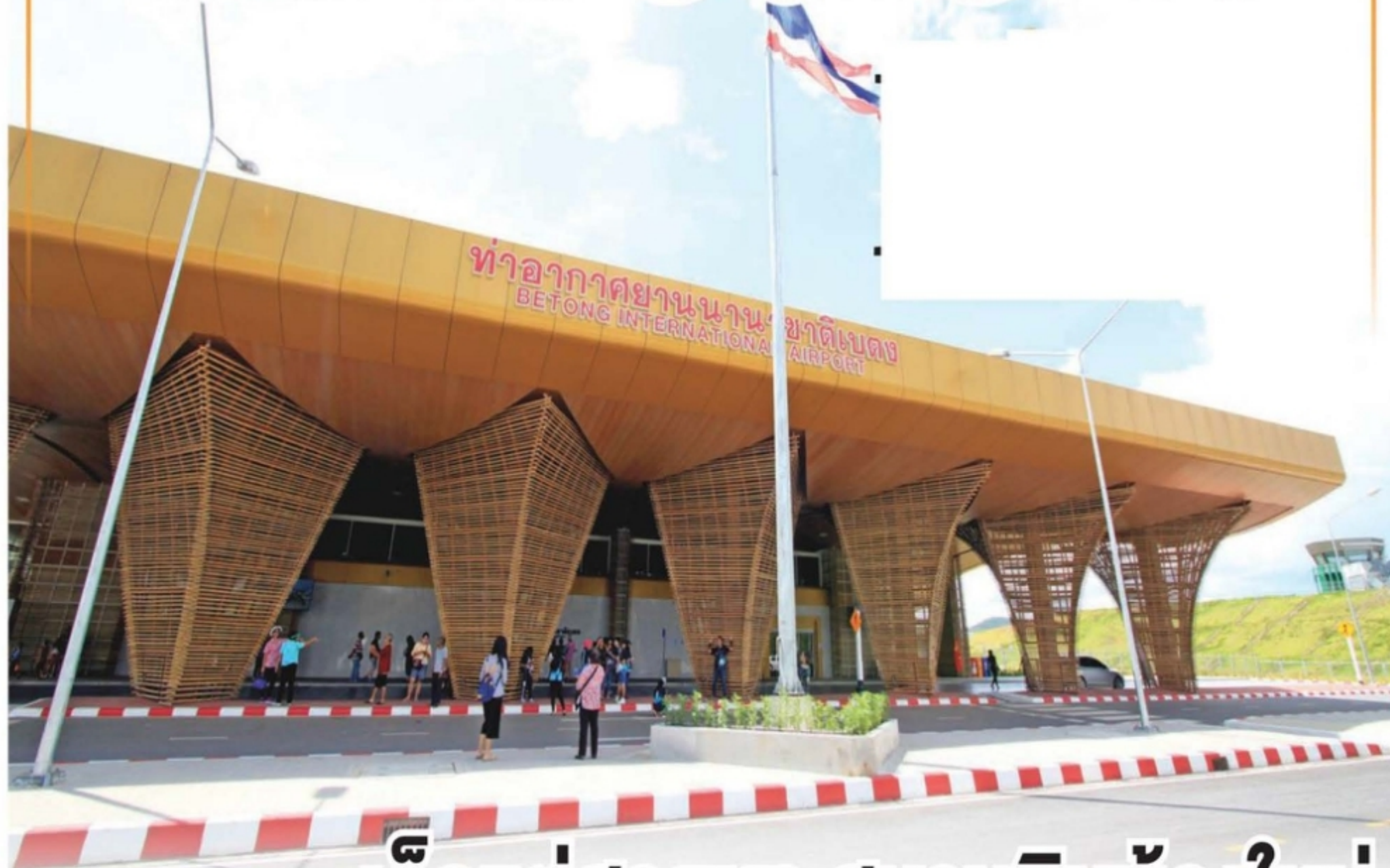
สนามบินเบตง