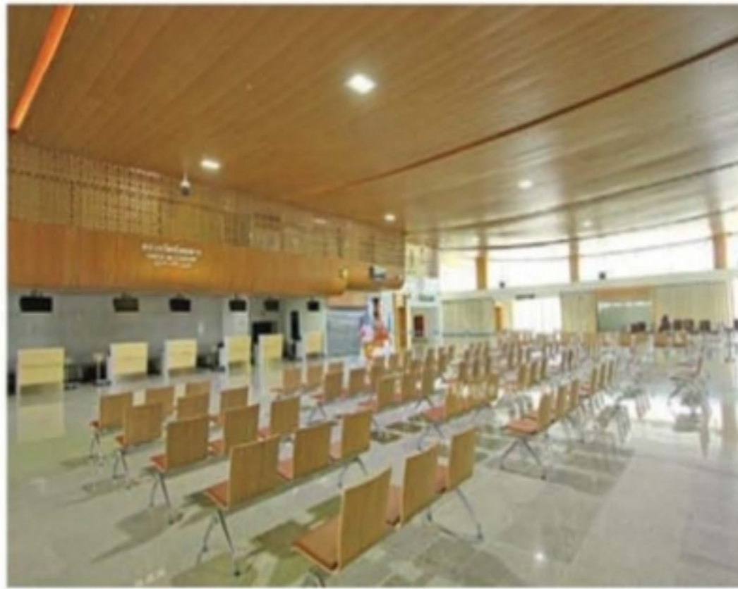
อาคารผู้โดยสารด้านนอก