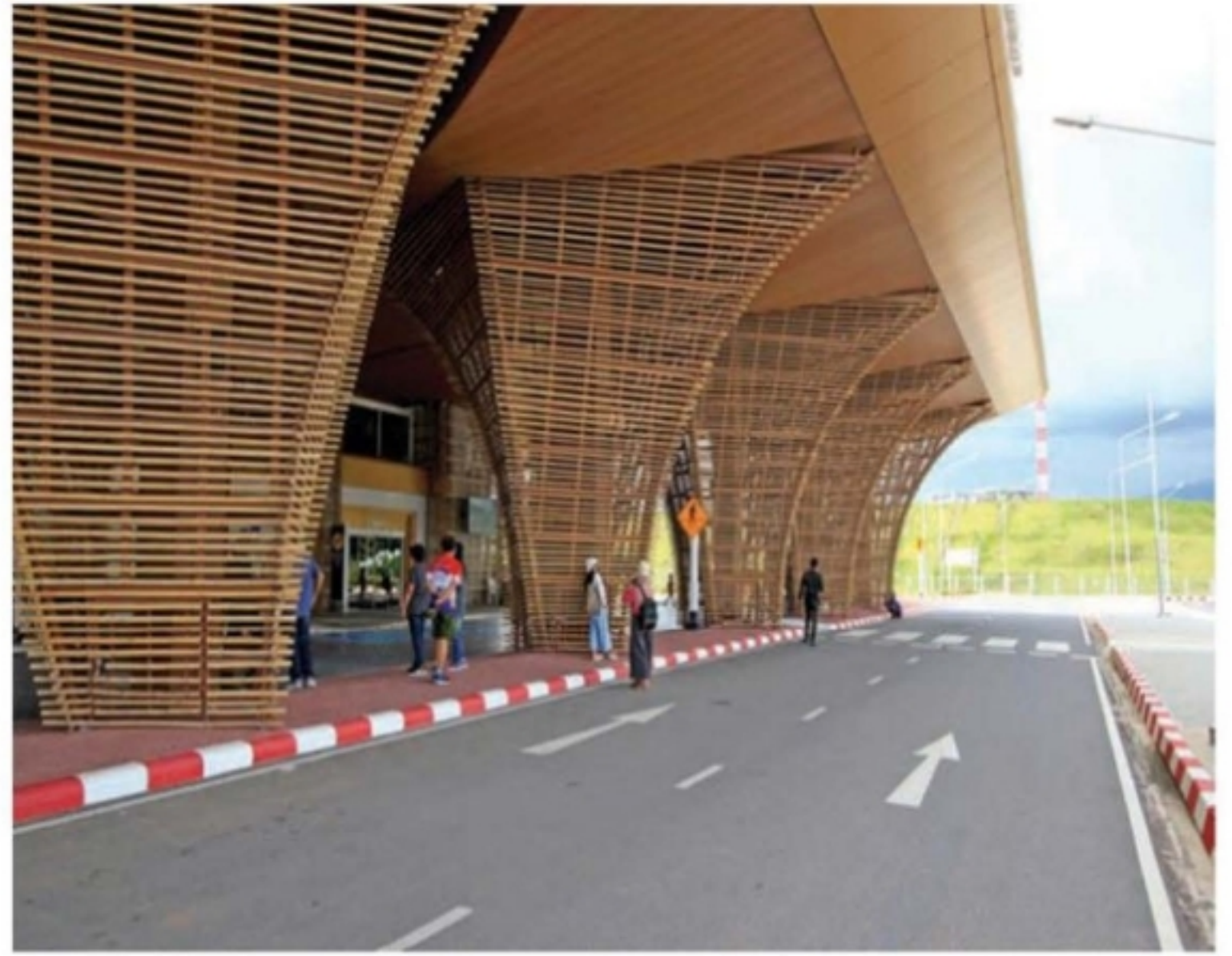
ตกแต่งด้วยไม้ไผ่