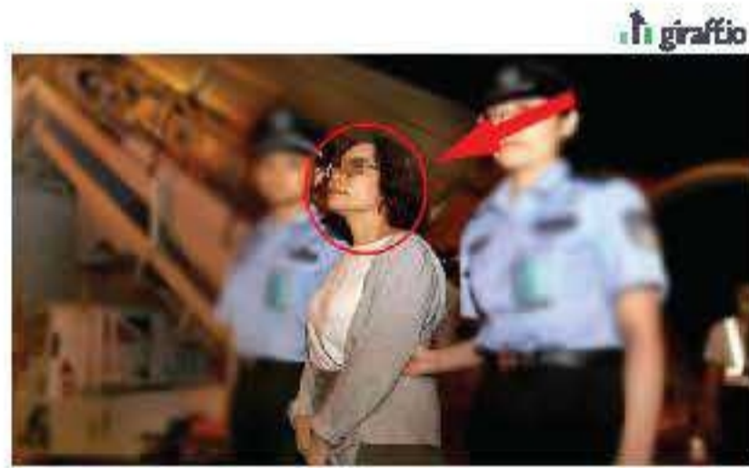
ข่าวฉาว! นักศึกษาผู้ที่คิดค้นวิธีลดน้ำหนักได้แบบ 100% ตกเป็นข่าวดัง!