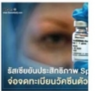
รัสเซียเผยวัคซีน Sputnik V"

ที่ผ่านมาจะเห็นได้ว่ารัฐพยายามผลักดันโครงสร้างพื้นฐานเพื่อรองรับการคมนาคมขนส่งที่สะดวกสบายมากขึ้น เช่นโครงการรถไฟฟ้าหลากสีที่ทยอยก่อสร้างและเปิดให้บริการนั้นที่ทำให้ประชาชนสามารถเดินทางได้สะดวกอย่างต่อเนื่อง แต่สำหรับโครงการระบบทางด่วนขั้นที่ 3 ของการทางพิเศษแห่งประเทศไทย (กทพ.) ซึ่งเป็นโครงการที่รัฐพยายามผลักดันควบคู่ไปพร้อมกับโครงการรถไฟฟ้าสายสีน้ำตาล ช่วงแคราย-ลำสาสี ระยะทาง 21.5 กิโลเมตร (กม.) กลับล้มไม่เป็นท่า เนื่องจากที่ผ่านมาทางกทพ.มีการเจรจากับมหาวิทยาลัยเกษตรศาสตร์เพื่อขอใช้พื้นที่บริเวณหน้ามก.ในการก่อสร้างโครงการดังกล่าวหลายต่อหลายครั้ง และมีทีท่าว่ามก.ยอมที่จะถอยทัพ เมื่อ กทพ.มีแนวคิดสร้างหลังคาโดมครอบทางด่วนและรถไฟฟ้าสายสีน้ำตาล ช่วงแคราย-ลำสาสี ซึ่งเป็นระบบป้องกันในการดักจับฝุ่นละอองขนาดเล็ก PM 2.5 เพื่อควบคุมมลภาวะทางอากาศ แต่สุดท้ายก็จมนมและไม่สามารถทำให้มก.ยอมรับโครงการนี้ได้ เพราะมีความกังวลทั้งด้านสิ่งแวดล้อมและมลพิษทางอากาศ