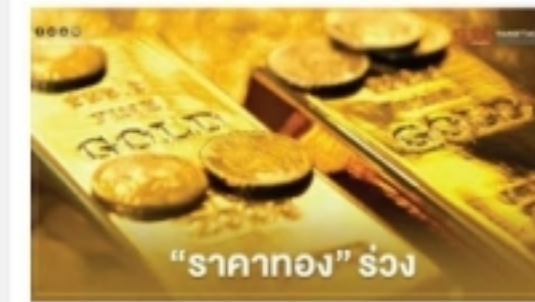
ราคาทองปิดลบ 14.8 ดอลลาร์ เหตุดอลลาร์แข็ง...