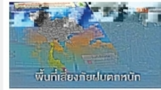
พื้นที่เสี่ยงภัยฝนตกหนักถึงหนักมากวันนี้(1...