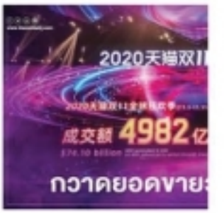
"อาลีบาบา" กวาดคนโสด 11.11 ก