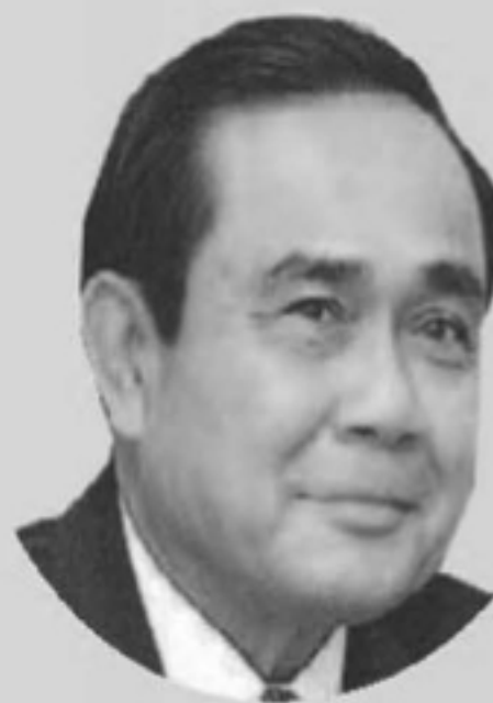
พ.อ.ประยุทธ์ จันทร์โอชา นายกรัฐมนตรี ประธาน