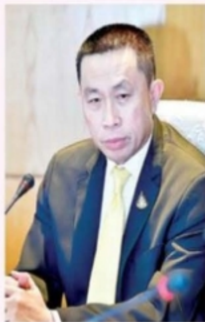
ศักดิ์สยาม

●●●ประชาชนหลายกลุ่มอาชีพทยอยรับเงินเยียวยา 5 พันบาทจากพิษโควิด-19 จากรัฐบาลไปแล้ว ถึงคิวหน่วยงานบ้าง ล่าสุด นายศักดิ์สยาม ชิดชอบรมว.คมนาคม เรียกประชุมหัวหน้าหน่วยงานในสังกัดเพื่อนำเสนอกรอบวงเงินตามมาตรการที่เข้าข่ายลักษณะแผนงานโครงการตามบัญชีแนบท้าย พ.ร.ก.ให้อำนาจกระทรวงการคลังกู้เงิน เพื่อแก้ไขปัญหา เยียวยา และฟื้นฟูเศรษฐกิจและสังคมที่ได้รับผลกระทบจากการแพร่ระบาดของไวรัสโควิด-19 ●●●เปิดตัวเลขเบื้องต้นมี 7 หน่วยงานที่นำเสนอวงเงินรวม 7,697 ล้านบาท ประกอบด้วย