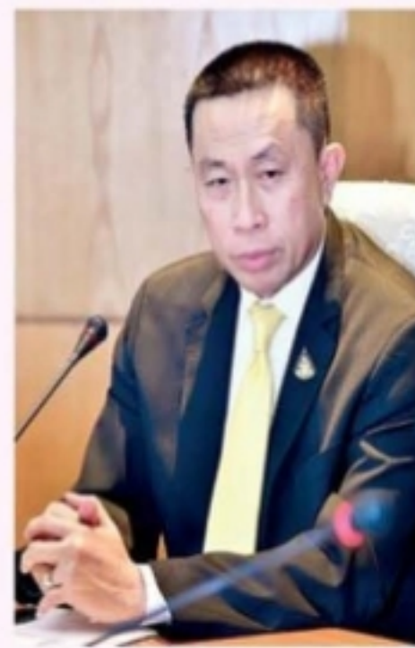
ศักดิ์สยาม

ทะเบียนในไทย และให้บริการเที่ยวบินภายในไทยด้วยอาจมีความเสี่ยงเรื่องการแพร่เชื้อ จึงออกประกาศเกี่ยวกับมาตรการการบินระหว่างประเทศสำหรับเที่ยวบินประจำ และเที่ยวบินเช่าเหมาลำใช้บังคับกับสายการบินที่จดทะเบียนในไทยทุกลำต้องดำเนินการตามระเบียบปฏิบัติของ กพท. โดยต้องแจ้งหน่วยงานรัฐของประเทศต่าง ๆ ที่ว่าจ้างเช่าเหมาลำสายการบินของไทยไปรับผู้โดยสารกลับถิ่นเกิดต้องกำหนดให้ผู้โดยสารทุกคนแสดงใบปลอดโรคโควิด-19 รวมไปถึงเที่ยวบินแบบประจำด้วย หากผู้โดยสารคนใดฝ่าฝืน กพท. จะใช้อำนาจตาม พ.ร.บ.เดินอากาศ 2497 ไม่อนุญาตให้ผู้โดยสารรายนั้นขึ้นเครื่องบิน