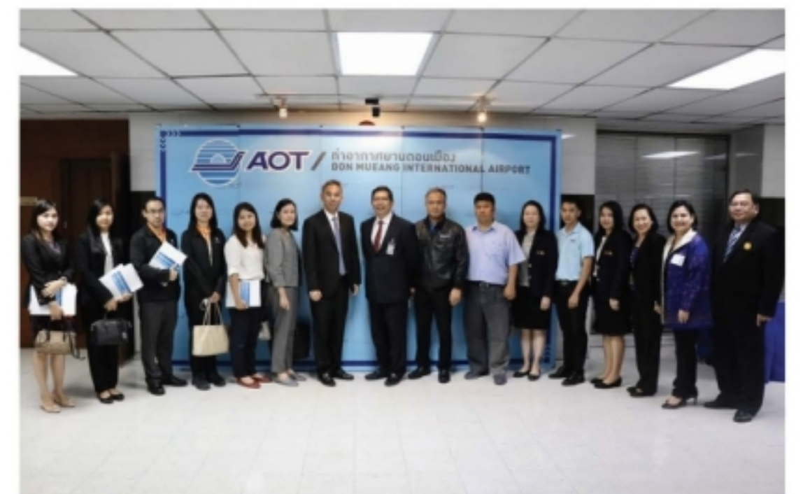
(https://www.siamturakij.com/news/26599-กตท-จัดโครงการรับฟังข้อคิดเห็นเพื่อพัฒนา...)