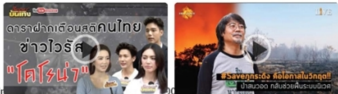
ดาราฝากเดือนสตูดิโอไทย ข่าวไวรัส "โคโรน่า" [Hot Issue] #Saveภรรยา คือ

อ่านเพิ่มเติม (https://mgronline.com/news-clips)