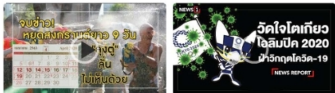
จมข่าวก่อนหยุดสงกรานต์ยาว 9 วัน "ลุงสู" สั่นไม่เห็นด้วย [NEWS REPORT] : วิกฤตโควิด 2020 - ฝ่าวิกฤตโควิด 19