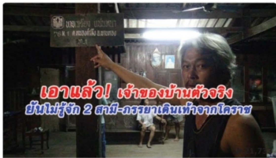
เอาแล้ว! ผอ.หนองตำลึง เตือนโลกออนไลน์ตรวจสอบข้อเท็จจริงข่าว 2 สามี-ภรรยาเดินเท้ากลับบ้าน