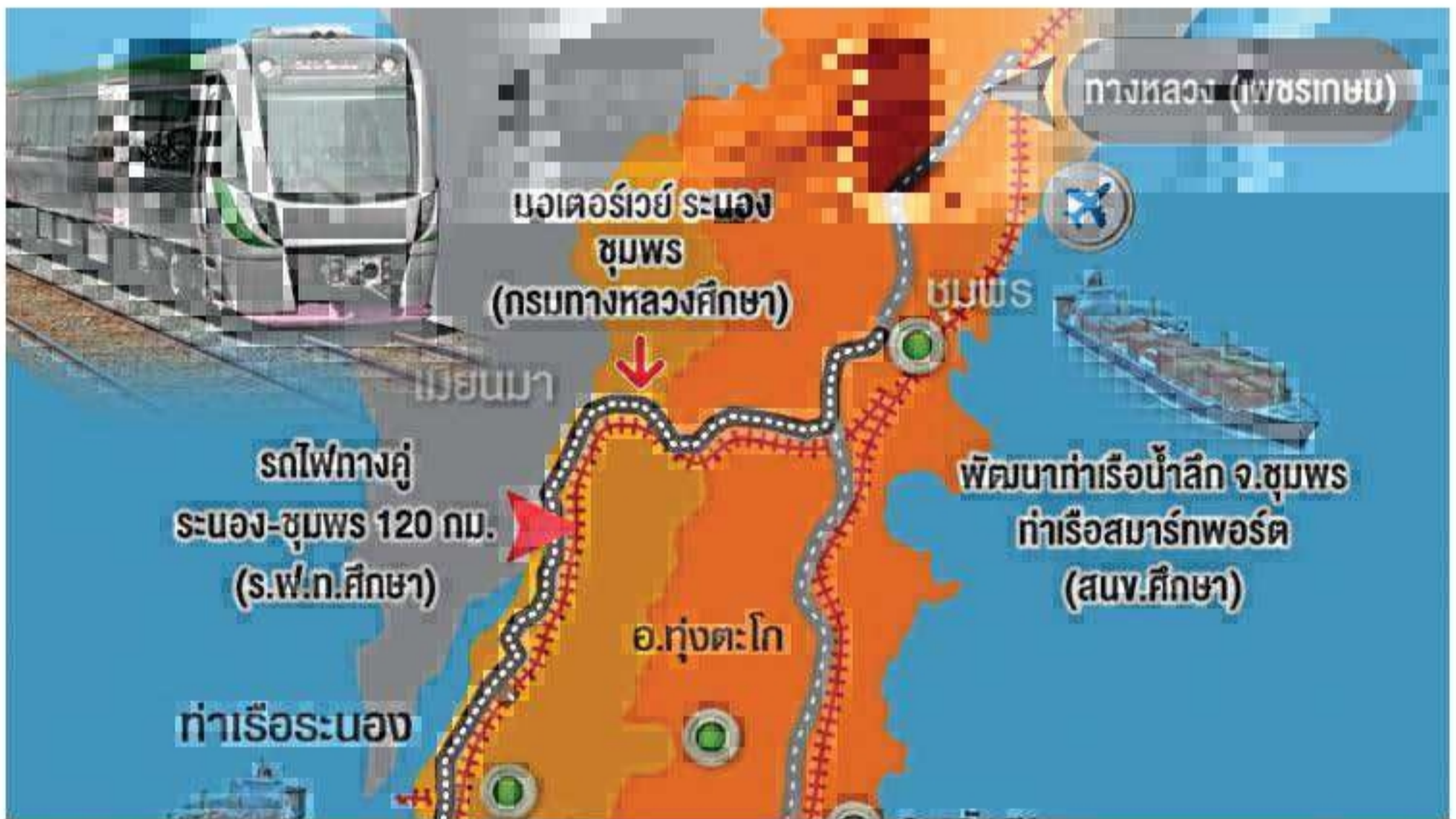
3 ธันวาคม 2563