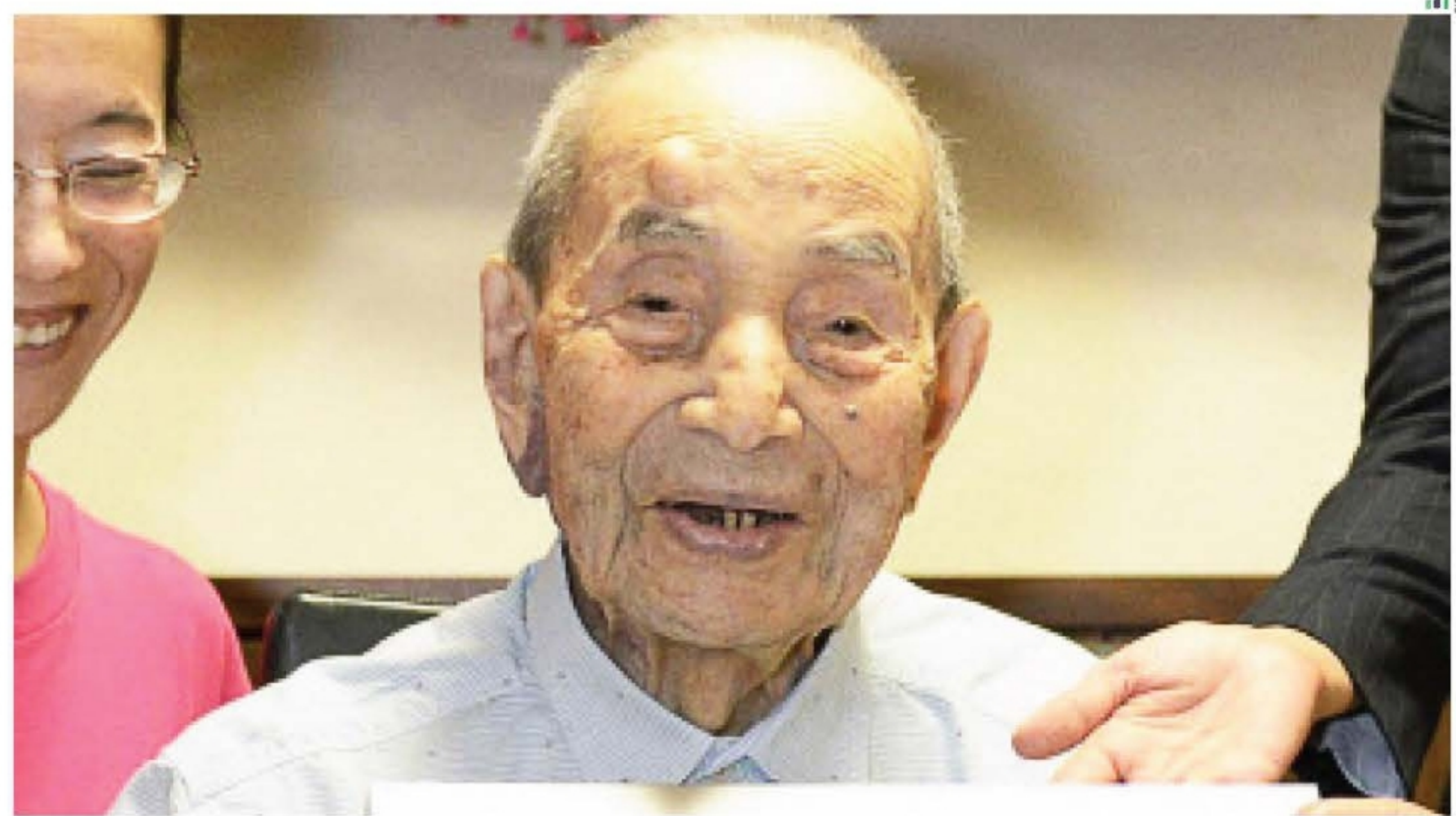
ชายไทยอายุ 120 ปีพูดว่า: กำจัดความดันโลหิตสูงใน 1 นาที เพียงใช้วิธีนี้