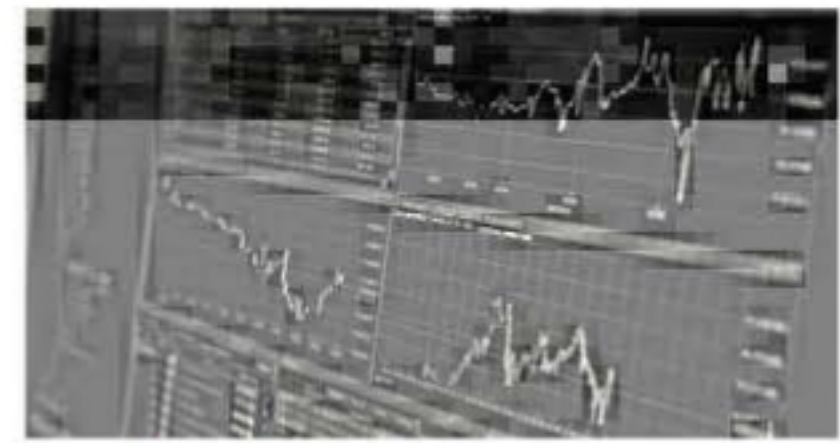
ดาวโจนส์ปิดร่วง 445.41 จุด วิตกผลประกอบการหดตัวเศรษฐกิจสหรัฐย่าแย่