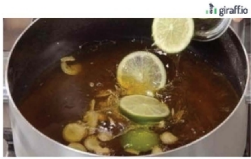
มอมจอนเก็อบจะปลิว! ระวัง ต้ม 1 แก้ว เฝ้ามลัญไฉมันได้ 4 กก Beauty&care

ทั้งนี้ที่ประชุมได้รับทราบรายละเอียดของโครงการดังกล่าวแล้ว และพร้อมที่จะให้ความร่วมมือ เนื่องจากเรามองว่าเป็นโครงการที่ดี เพราะเป็นประโยชน์ต่อประชาชนในการเดินทาง ทั้งนี้ได้สั่งการ ขบ.ให้ข้อมูลระบบจีพีเอสแท็กซี่ เพื่อติดตามการให้บริการแท็กซี่บนถนนพระราม 4 ขณะที่ ขสมก. จะให้ข้อมูลปริมาณรถโดยสารประจำทาง (รถเมล์) ในกรุงเทพฯ และปริมณฑล บริการแนวเส้นทางผ่านถนนพระราม 4 ขณะที่การทางพิเศษแห่งประเทศไทย (กทพ.) จะให้ข้อมูลปริมาณรถที่เข้าออกจากด่านเก็บค่าผ่านทาง พระราม 4 บนทางพิเศษเฉลิมมหานคร สายดินแดง-ท่าเรือ และด่านหัวลำโพง บนทางพิเศษศรีรัช ให้ความร่วมมือในการให้ข้อมูลเพื่อดำเนินการโครงการ พระราม 4 โมเดล หากสำเร็จก็จะเป็นต้นแบบในการบริหารจัดการจราจรในพื้นที่ต่อไป