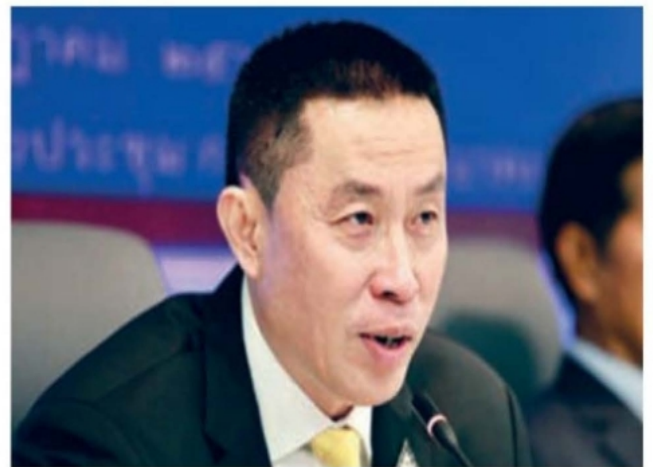
ศักดิ์สยาม ชิดชอบ

โครงการลงทุนโครงสร้างพื้นฐานขนาดใหญ่หรือ เมกะโปรเจกต์เป็นความหวังของรัฐบาล พลเอกประยุทธ์ จันทร์โอชา ที่จะนำมาขับเคลื่อนเศรษฐกิจ ยิ่งในภาวะที่ เศรษฐกิจชะลอตัวและได้รับผลกระทบจากเศรษฐกิจโลก ยิ่งจำเป็นต้องเร่งผลักดันโดยด่วน