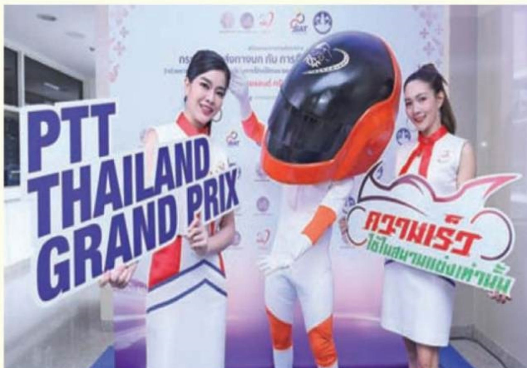
รถแข่งโครงการซบซีปลอดภัย

"การเป็นเจ้าภาพจัดการแข่งขันมอเตอร์สปอร์ตระดับโลกในประเทศไทย ส่งผลให้มีผู้ชมเดินทางมาจากทั้งในและต่างประเทศ โดยส่วนใหญ่เดินทางโดยโครงการซบซี ทางบก ฉะนั้น กรมการขนส่งทางบกจึงเป็นหน่วยงานสำคัญมาก ที่ให้การสนับสนุนทั้งในเรื่องการอำนวยความสะดวก และความปลอดภัยของเส้นทาง นอกจากนี้ยังมีโครงการความร่วมมือระหว่างกันในการรณรงค์การซบซีปลอดภัย ซึ่งทาง กทท. ต้องขอขอบคุณอีกครั้งที่ทางขนส่งทางบกเห็นความสำคัญ และให้ความร่วมมือในการจัดงานครั้งนี้"