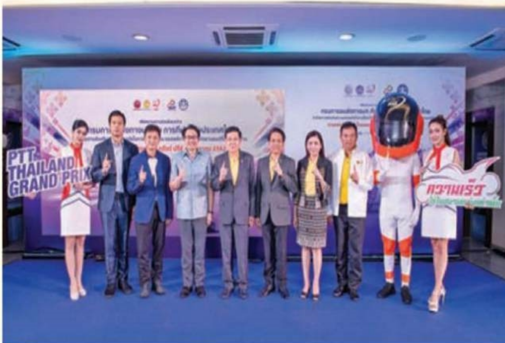
ประกาศความพร้อมสู่ปีที่ 2 ต้องดีกว่าเดิม