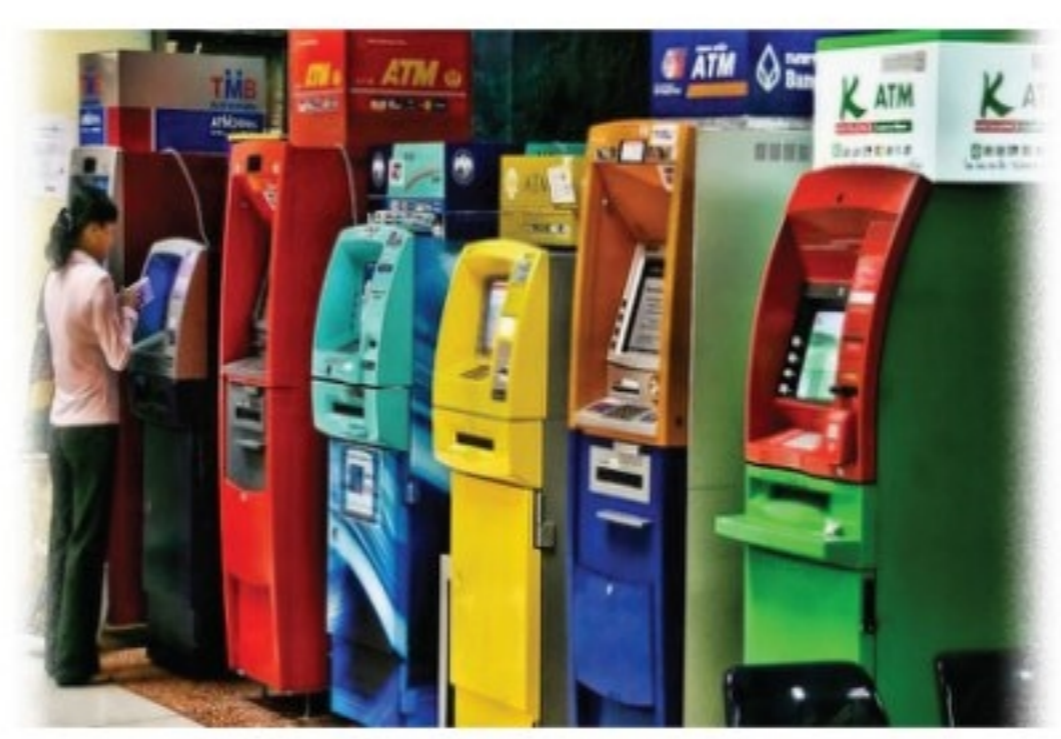
แบงก์เร่งหาเทคโนโลยี-คน' เสริมทัพแข่งเดือด