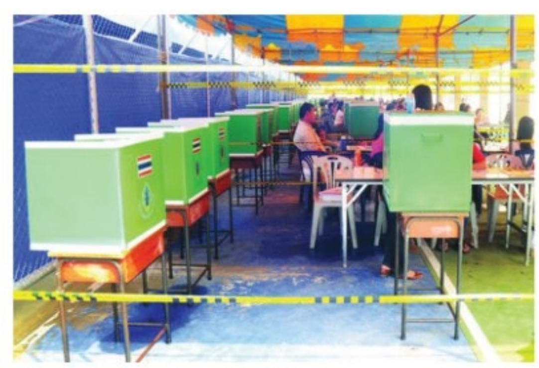
แบ่งเขตใหม่41จังหวัดส.ส.เพิ่ม