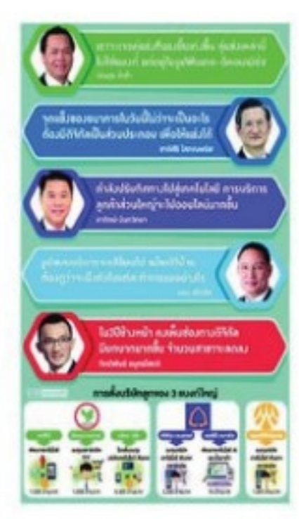
ซีไอแบงก์สั่งสุ่ศีกดิจิทัล