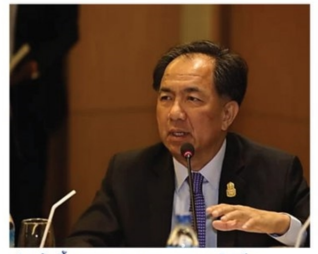
เร่งแก้หนี้เกษตรกร เสนอกรม.4ก.ย.ไฟเขียว