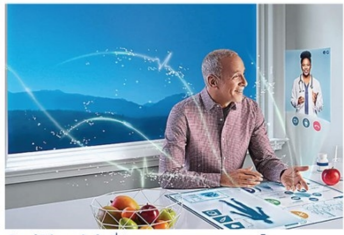
เรียนรู้วิธีการบำบัดที่ช่วยลดการลุกลามของมะเร็ง