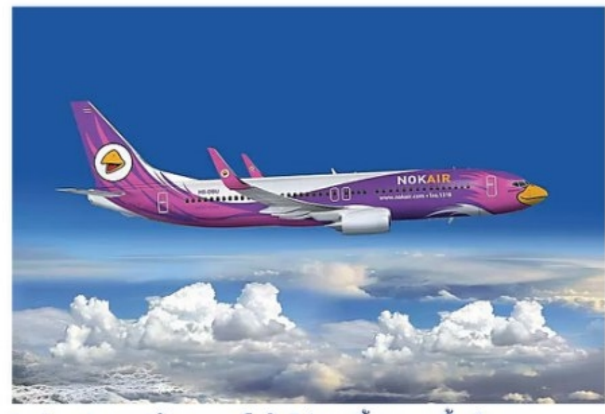
"กลุ่มจุฬารัง"อุ้มนกแอร์ ยันไม่ขายทิ้งหากนพื้นกิจการ