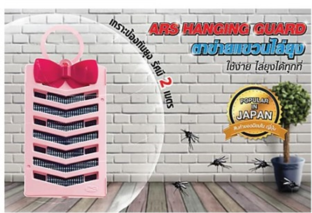
การไลยุงแบบง่ายๆ ที่คุณต้องทึ่ง