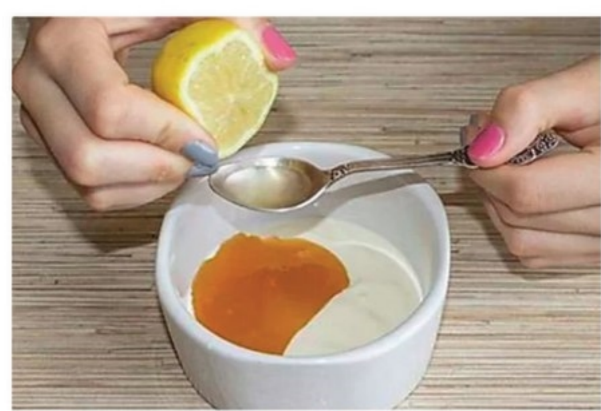
เขาเปลี่ยนแปลงหน้าห้องได้ด้วยสิ่งนี้