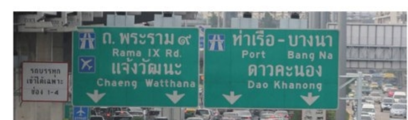
หนุนใช้บัตรแทนเงินสด! หวัง5ปีแก้ปัญหารถติดหน้าด่านทางด่วน