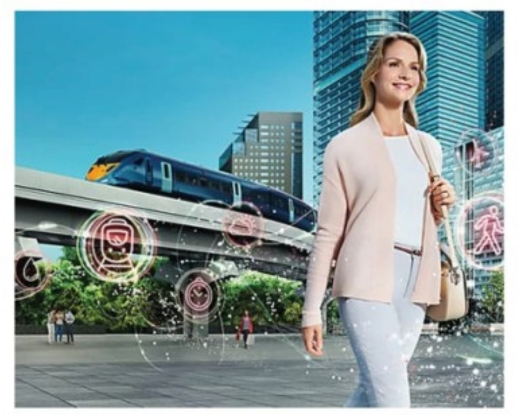
จะเป็นอย่างไรถ้าลิฟท์รู้ใจคุณ? มาร่วมค้นหากับเรา นวัตกรรมเพื่อสังคม : อีตาอี