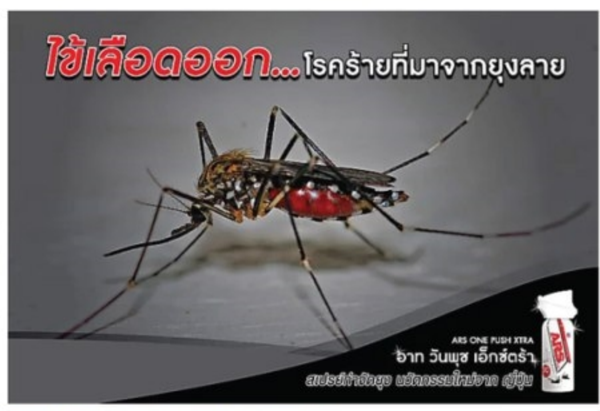
หมดปัญหาุงและแมลงวันกวนใจ ARS