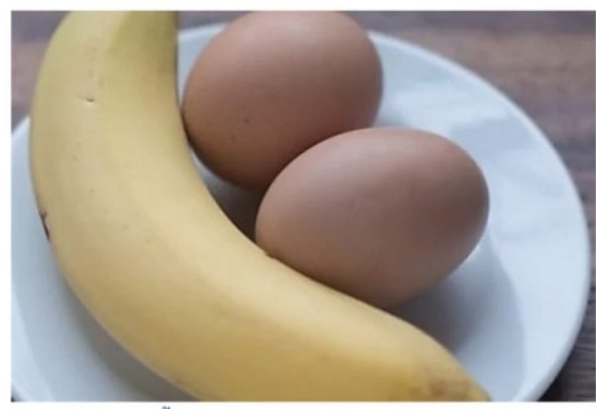
ตัวช่วยใหม่ ลดน้ำหนักได้ผลจริง มี อย. รับรอง asia-track.xyz