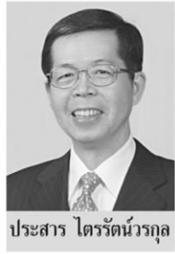
ประสาร ไตรรัตน์วรกุล

นายประสาร ไตรรัตน์วรกุล อดีตผู้ว่าการธนาคารแห่งประเทศไทย (ธปท.) หนึ่งในกรรมการนโยบายรัฐวิสาหกิจ กล่าวในรายการเดินหน้าประเทศไทย ว่า รัฐวิสาหกิจเป็นกลไกของรัฐในการขับเคลื่อนเศรษฐกิจ และการลงทุนของประเทศ รวมถึงเป็นผู้ให้บริการสาธารณะแก่ประชาชน ดังนั้น